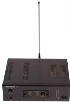
小型ループアンプ本体 チューナーユニット組み込み HS-10