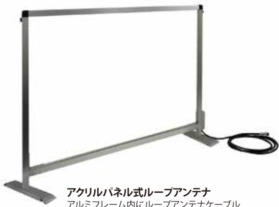
アクリルパネル式ループアンテナ アルミフレーム内にループアンテナケーブルを内蔵しています。 外形:約935mm(横)×675mm(高さ) スタンド・結線ボックスを除く