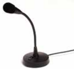
スタンド式有線マイク FD-13α