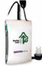
ヒアリングループ受信機 SOR-100