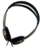
受信機接続 アダプタ付 ヘッドフォン