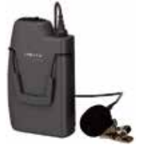
タイピン型ワイヤレスマイク WM-3100